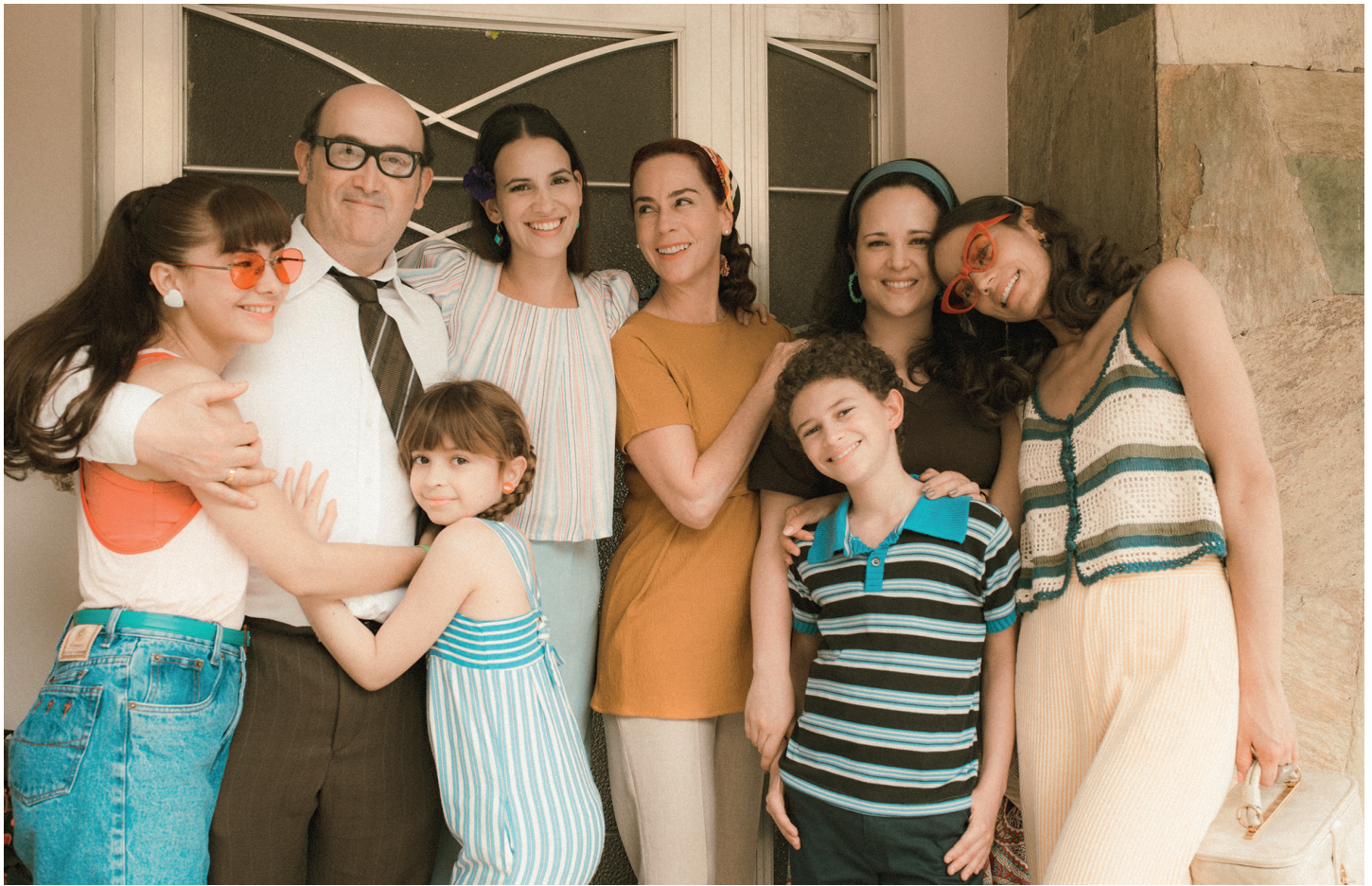
"El mejor método de educación es la felicidad." Héctor Abad