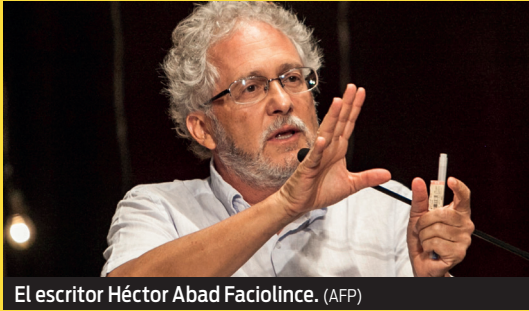
El escritor Héctor Abad Faciolince.

El título de la novela es el primer verso de un soneto de Jorge Luis Borges , Aquí. Hoy , que el padre del novelista llevaba en su bolsillo el día de su asesinato.