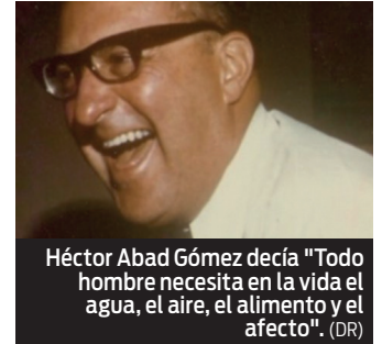
Héctor Abad Gómez decía "Todo hombre necesita en la vida el agua, el aire, el alimento y el afecto". (DR)

Héctor Abad Gómez (Jericó 1921- Medellín 1987) fue un destacado médico, profesor de Medicina en Antioquía, especializado en salud pública e investigador en Ciencias de la Salud. Abogaba por una medicina preventiva más que curativa, haciendo hincapié en la atención primaria, la vacunación de los más desfavorecidos y la importancia de invertir en el agua potable. Además de llevar a cabo en Colombia numerosos proyectos de salud, trabajó como asociado de la OMS. En Filipinas fundó una escuela de salud pública.