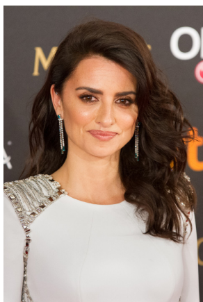
Penelope Cruz (Azucena)

En los márgenes (2022) L'Immensità (2022) Madres paralelas (2021) Competencia oficial (2021) Dolor y Gloria (2019) Volver (2005)