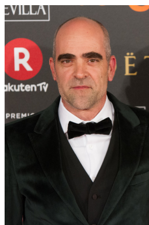
Luis Tosar (Rafa)

En los márgenes (2022) L'Immensità (2022) Madres paralelas (2021) Competencia oficial (2021) Dolor y Gloria (2019) Volver (2005)