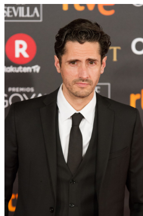
Juan Diego Botto (Manuel)

En los márgenes (2022) El Escuadrón Suicida (2021) No me mires a los ojos (2021) Los europeos (2020) Rocambola (2019) Vete de mi (2006)